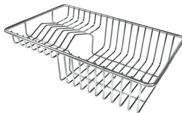
Tellerkorb aus Edelstahl 8100 303 * nur in Kombination mit dem Zubehör 8644 101