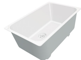
Weißer Wanne 8153 100